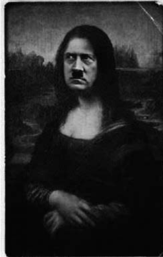
15 Mona Lisa Hitler bajusszal