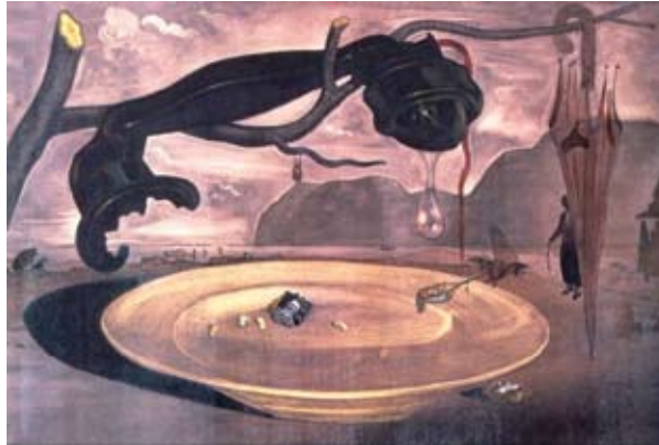
16 Salvador Dali: Hitler