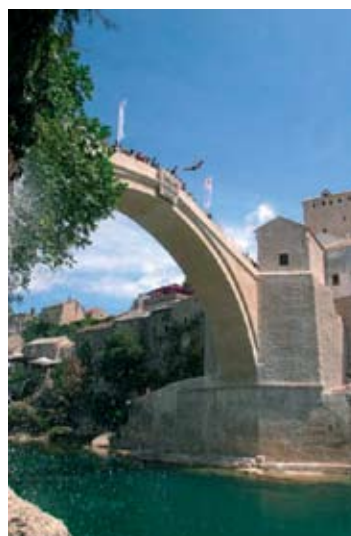
10. Régi hagyomány – ma: hídugrók