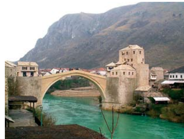
2-3. A híd