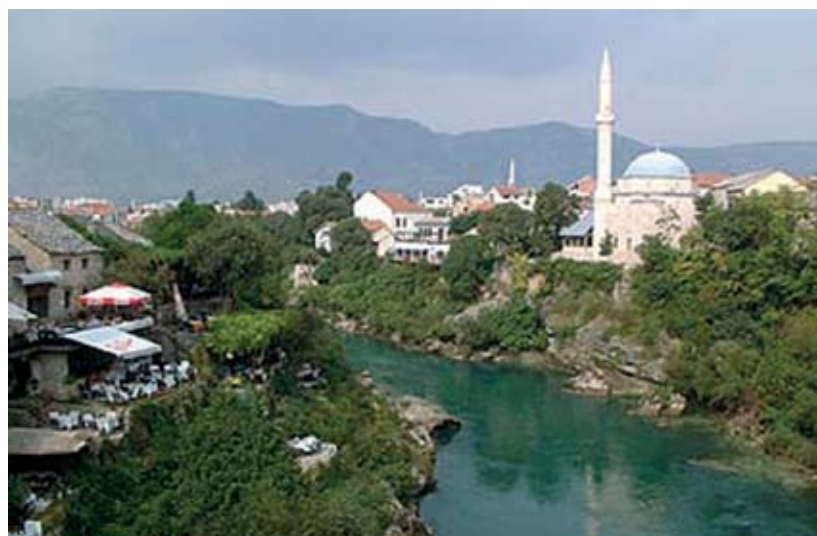
4. Bosnyák mecset