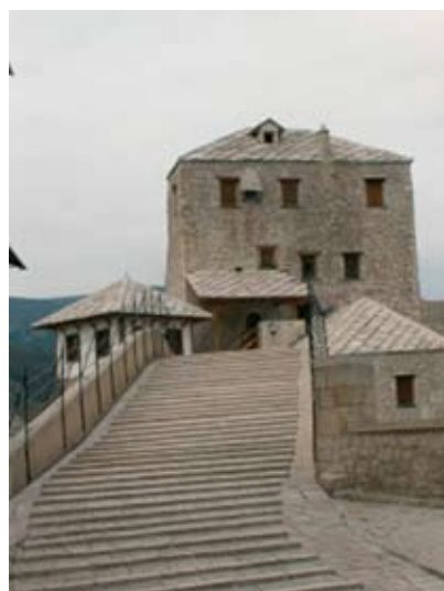
15–16. Az új híd feljárói