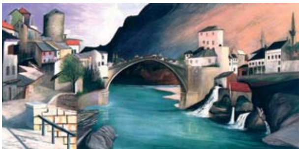
1. Csontváry Kosztka Tivadar: Római Híd Mosztárban