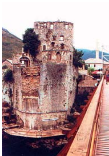
12. Az ideiglenes fahíd