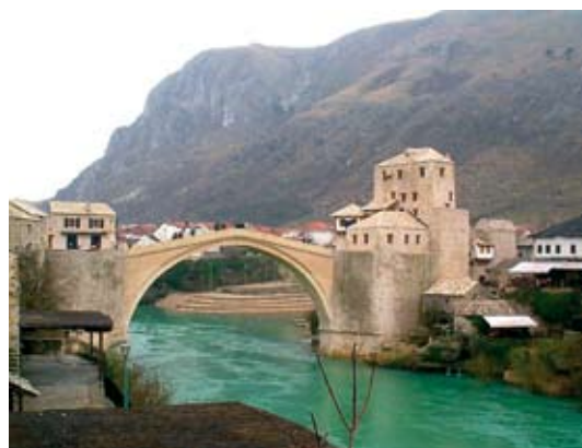
17. Az újjáépített híd látképe