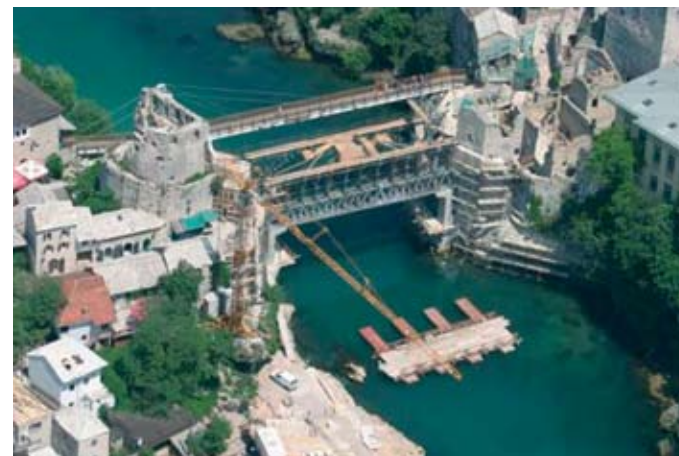
13–14. Az új híd építése