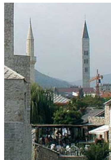
5. Katolikus templom