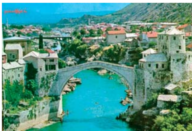
9. Egy 1970-es képeslap