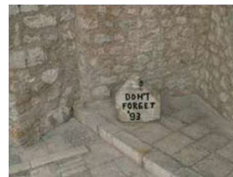
18. Egy kő a régi hídból. Felirata: Don't forget!