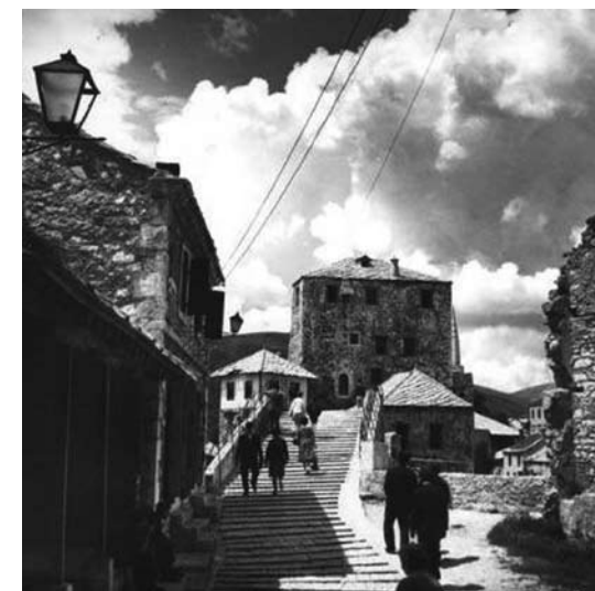
6–8. A híd az ötvenes években