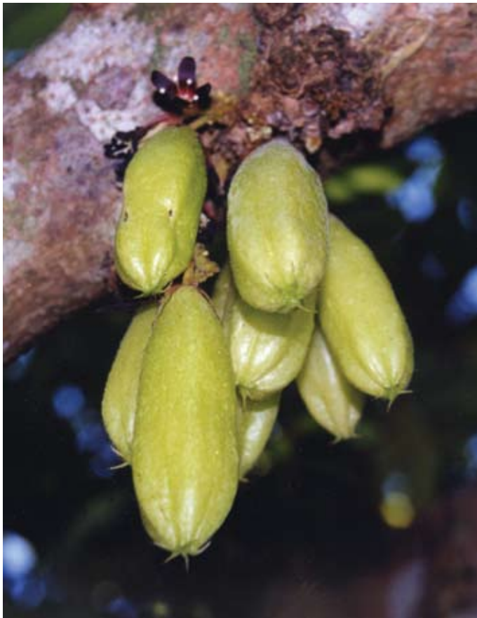
Kakaófa még éretlen terméssel

Néhány növényi mag különös karriert fut be. A szentjánoskenyérfa-magok például annyira egyformák, hogy évszázadokon át ezekkel mérték a drágaköveket. A Theobroma cacao magját Amerika őslakói, elsősorban az azték és maja indiánok tartották nagy becsben: „Mexikóban a XVI. század elején a kakaóbab volt a pénzgazdálkodás alapja. Ezt követően még hosszú ideig pénzként használták egész Közép-Amerikában és Dél-Amerika északi részének nedves trópusi esőerdő borította területein, ahol a 10–15 méteres örökzöld növény őshonos.