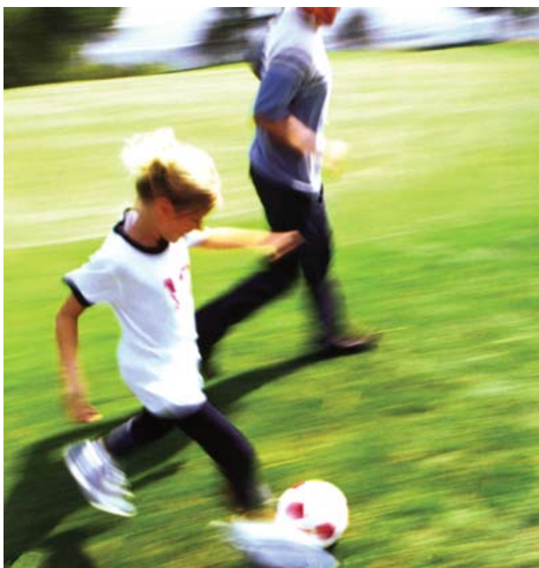
A játék öröme labdával