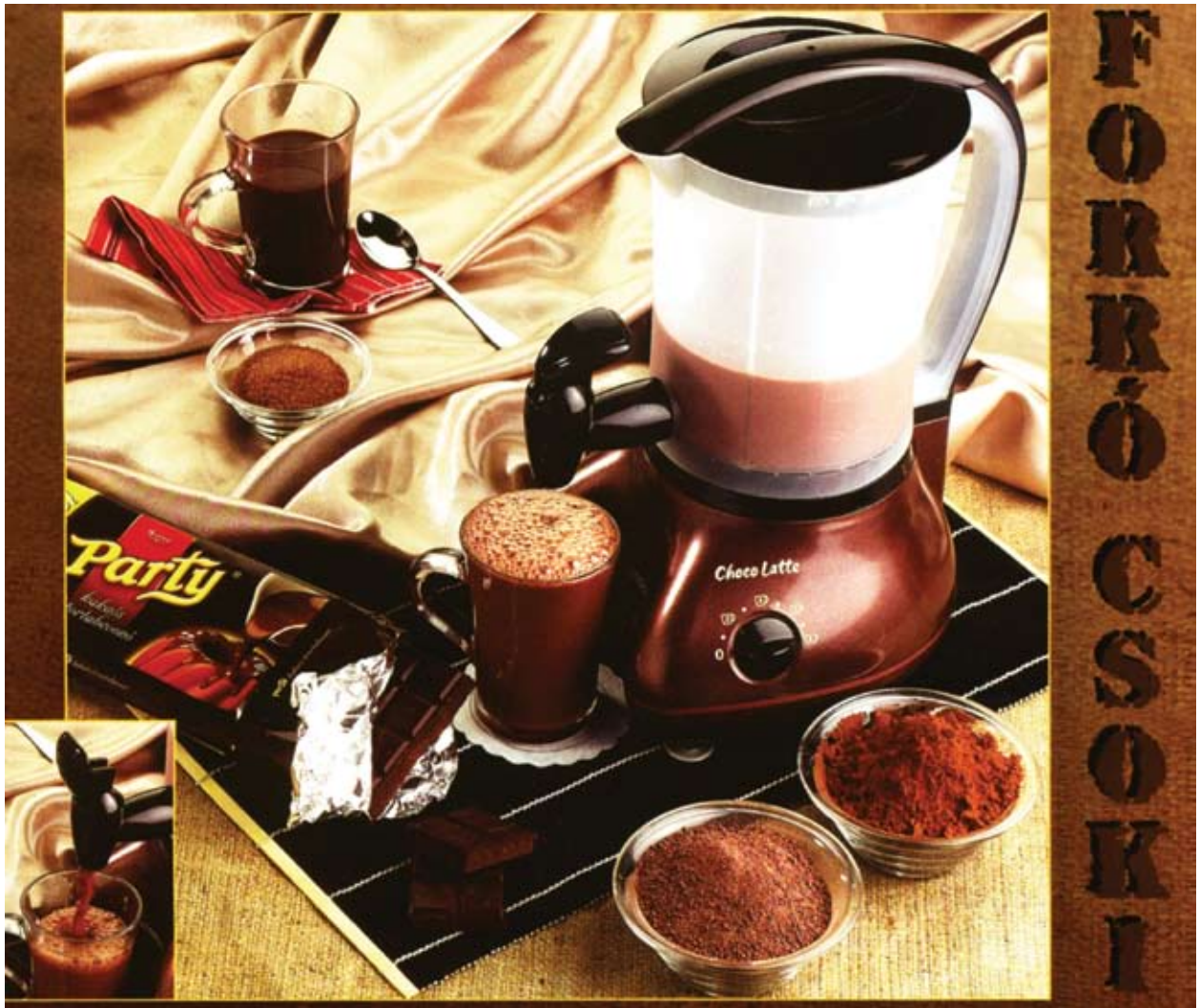
Forró csoki