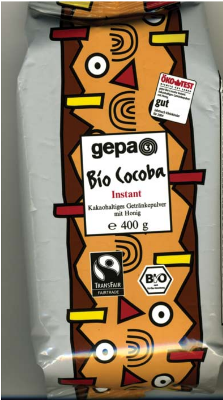
Fair Trade („méltányos kereskedelem”) kakaópor (Fotó: Tomory Ibolya)

(Forrás: http://www.harmonet.hu/cikk.php3?rovat=63&alrovat=68&cikkid=2641&dire=magikus&again=true )