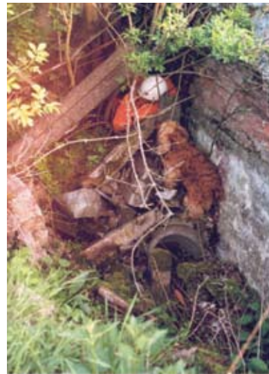
4. Gyakorlat közben