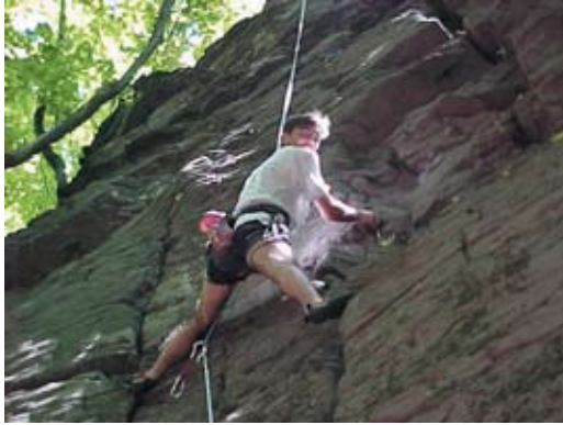
1. Alpintechnikai gyakorlat