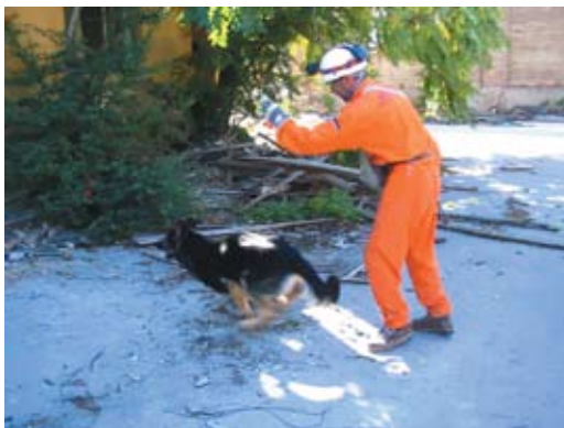
11. Nemzetközi bevetési gyakorlat (Szlovénia)