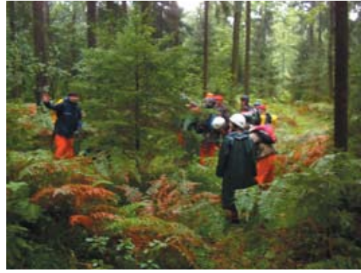
10. Nemzetközi bevetési gyakorlat (Szlovénia)