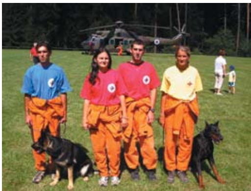
9. Nemzetközi bevetési gyakorlat (Szlovénia)