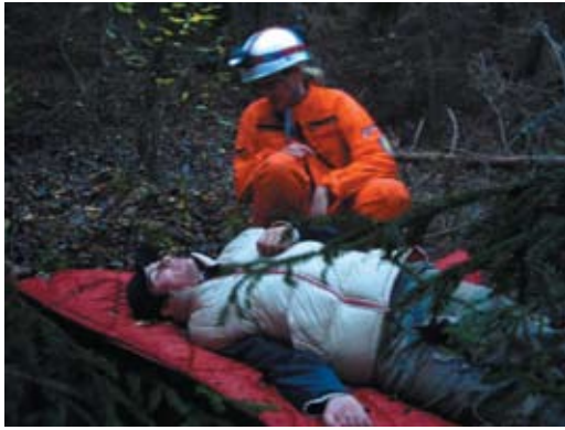
7. Bevetési gyakorlat terepen