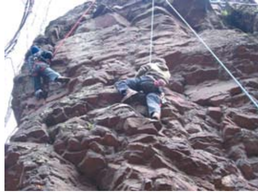
2. Alpintechnikai gyakorlat