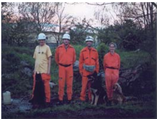
5. Gyakorlat közben