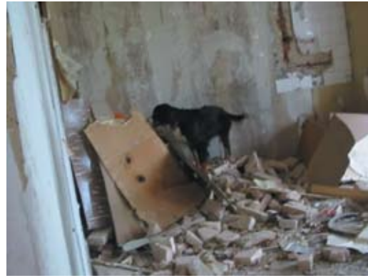
8. Bevetési gyakorlat romon