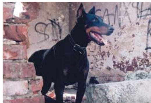
6. Gyakorlat közben