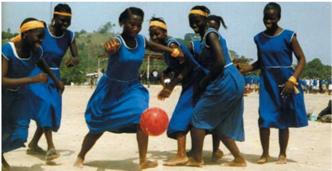
Életmentő futball és a lányok jogai egyszerre érvényesülhetnek

A lányok jogai különleges helyet kapnak, mert ők nagyobb arányban veszélyeztetettek. A sporton és játékon nemcsak a kikapcsolódásra, hanem beszélgetésre is lehetőséget kapnak. A nyitott, érzékenységet tekintetbe vevő kommunikáció segít megismerni a betegségtől való védekezés lehetőségeit, hogy magukat jobban megvédhessék. Kortársaikkal kapcsolatba kerülnek, barátságokat kötnek, és más kortársaikat is megtanítják a fertőzés elkerülésére vagy a már fertőzötteknek nyújtott segítségi lehetőségekre.