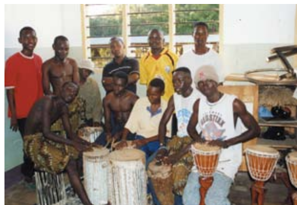
Lányok a pályán