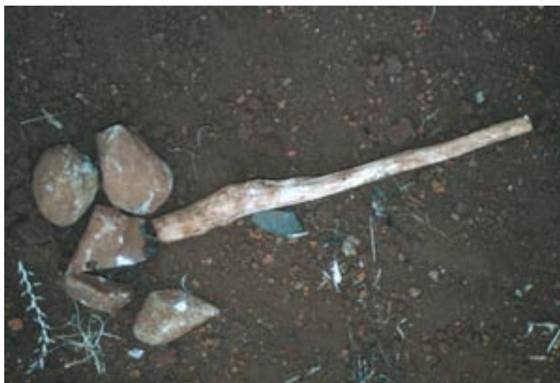
Egy kikuju nagyapa ártó erőket riasztó, jó lelkeket idéző tárgyai, Kenya

A Mundu Mugu nevű jó varázsló például örökletesen jut hozzá szerepéhez, de tanulnia is kell. Segítségül lehet hívni, ha például valaki úgy látja, hogy családját, kertjét, földjét veszélyezteti valamely ártó hatalom, például egy másik varázserővel bíró személy, akit gonosz szándék vezet. Az idős emberek között manapság is többen ismerik az egyes tárgyak, kövek, fa, növények stb. elhelyezésének módját, kombinációját. Az alábbi fotón egy 96 év körüli öregember „riasztóját” láthatjátok, amit kertjében pontosan a gyalogösvény közepén, a termőföld és a kerítés között helyezett el. A kövek és a fadarab egymáshoz való viszonya és iránya is fontos, a helytelen elhelyezés ugyanis kellemetlen következményeket vonhat maga után, így azonban sem szellemnek, sem földön élő állatnak vagy embernek nem lesz kedve a kertben kárt tenni nagyapa hite szerint. Mivel neki jó kapcsolata van az ősök szellemével, a földi meg az eltávozott lelkekkel, sikerrel járt a védelem: nem háborgatta semmi nagyapa munkája eredményét.